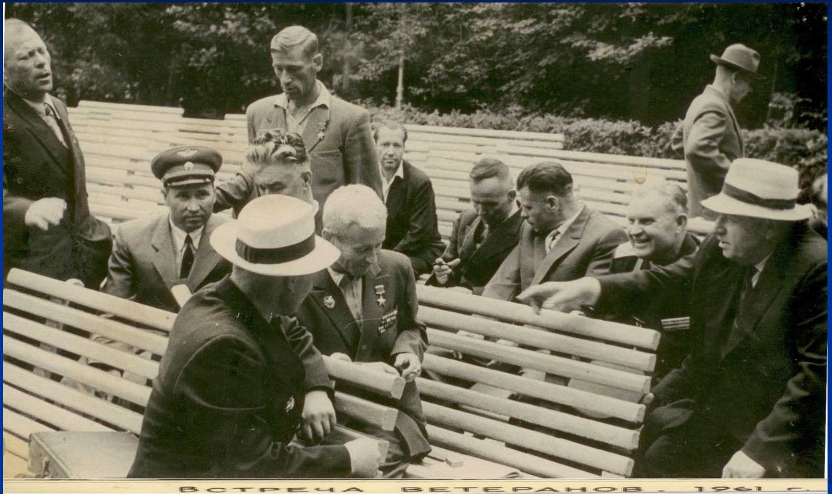
Встреча ветеранов. Москва. 1961г.