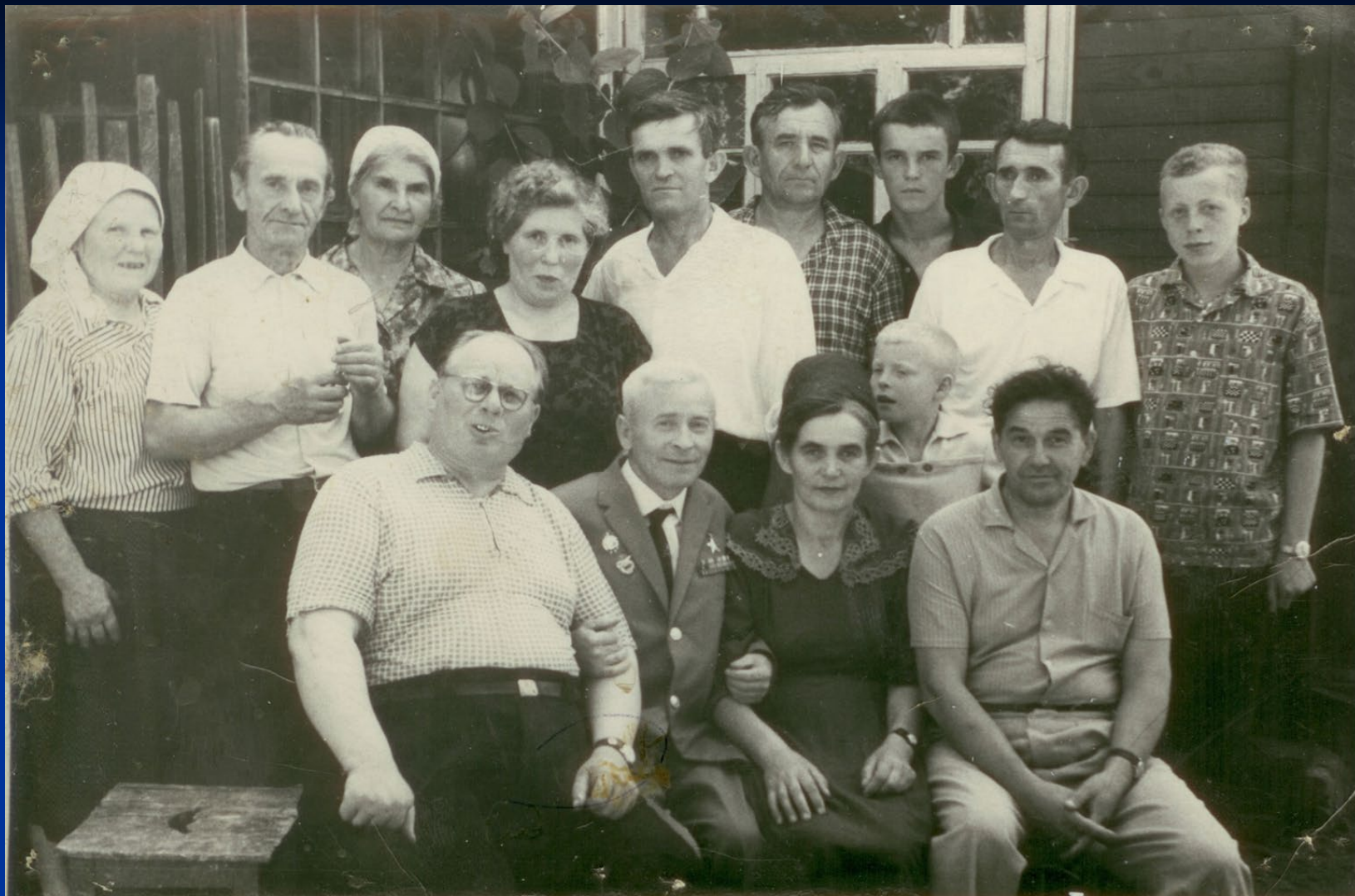
В гостях у партизан Брянска в г. Дятьково. 1966 г.