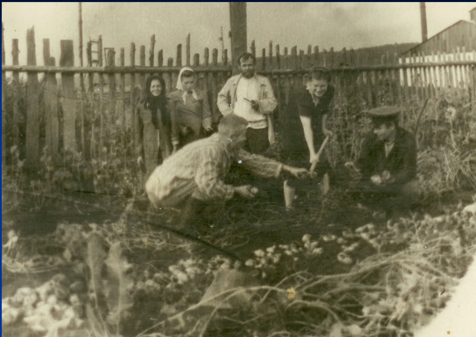
На родительском огороде