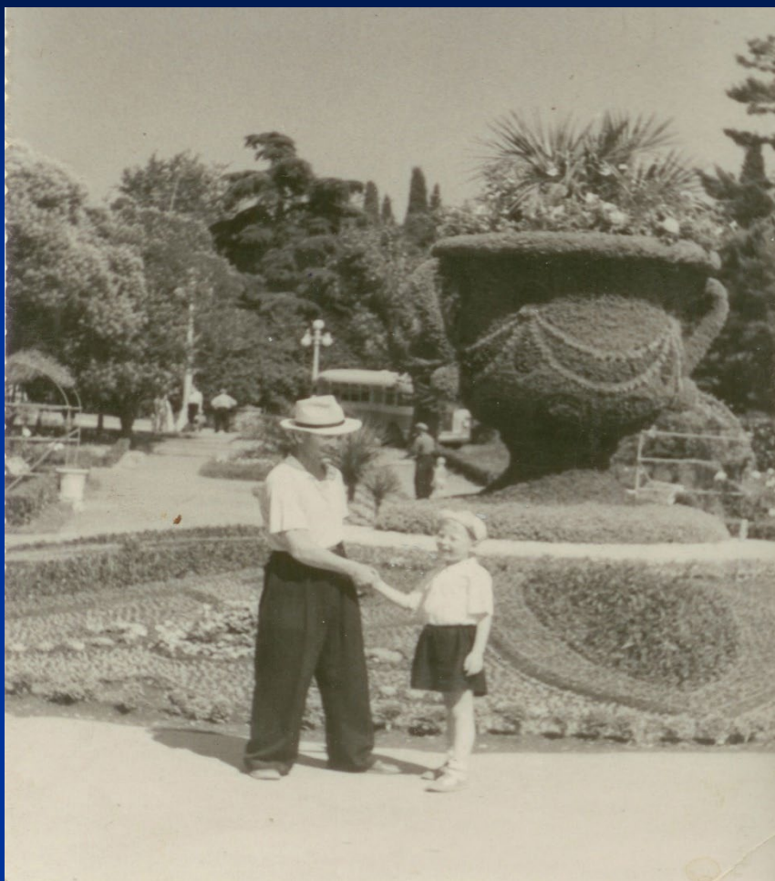
На отдыхе с сыном