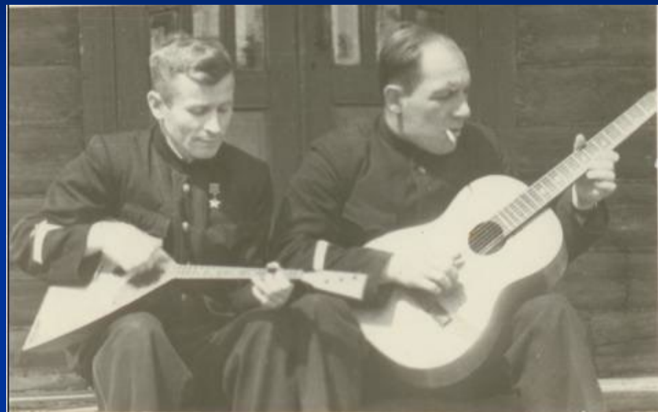
В ЧАСЫ ДОСУГА